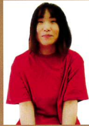
空音 青・京子 赤・雪子